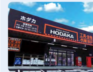
ホダカ株式会社 (57店舗)

工具・金物・作業用品・作業衣料の専門店。プロの方から道具にこだわる一般のお客さままでご満足いただける店舗づくりを目指しています。