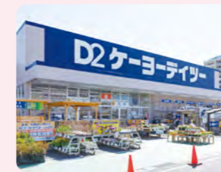
株式会社ケーヨー ※持分法適用会社 (164店舗)

グループの総合力を活かした事業展開により、お客さまのお困りごとの解決や、「くらしをもっと良くしたい」というお客さまのニーズの実現をサポートするための最適な商品やサービスのご提案に加え、防災用具の幅広い取り扱いなどにより、非常事態下でもお客さまのくらしをお守りします。